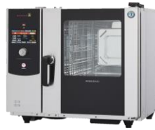
スチコンバクショオープン MIC-5HTC3