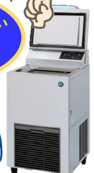
リキッドフリーザー HLF-3A